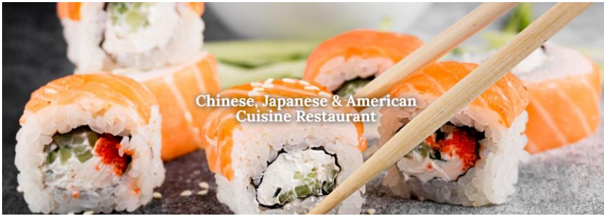
Chinese, Japanese & American Cuisine Restaurant

OCCA Members 10% Off with OCCA 2022 Membership ID